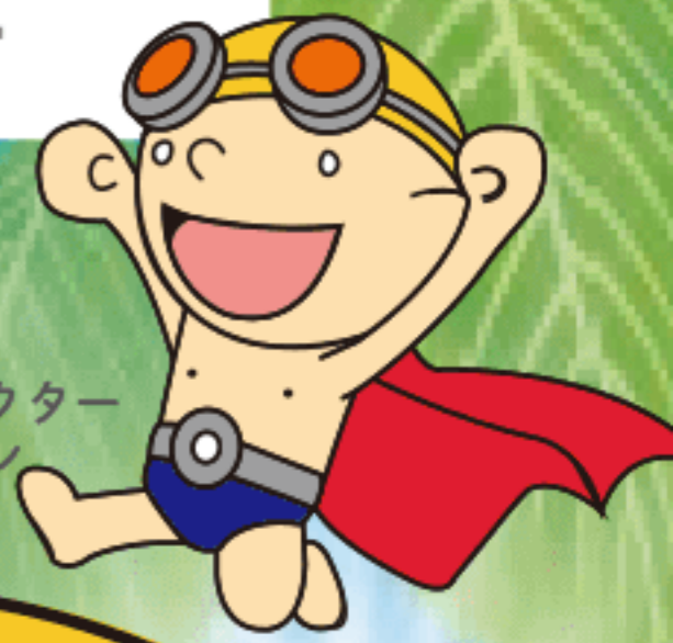
新田塚キャラクター およくマン