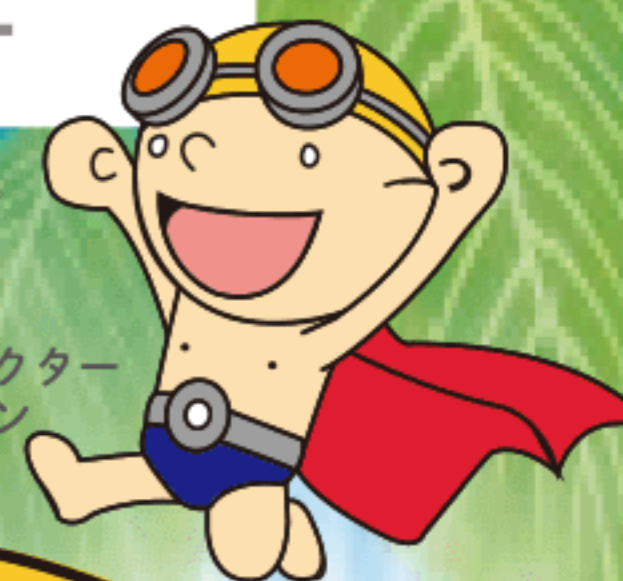
新田塚キャラクター およくマン